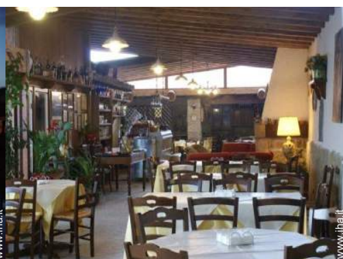
Sistemazione interna a disposizione degli ospiti