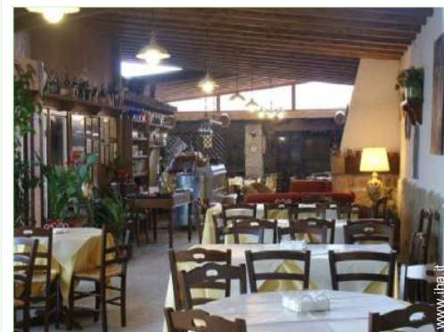
Sistemazione interna a disposizione degli ospiti