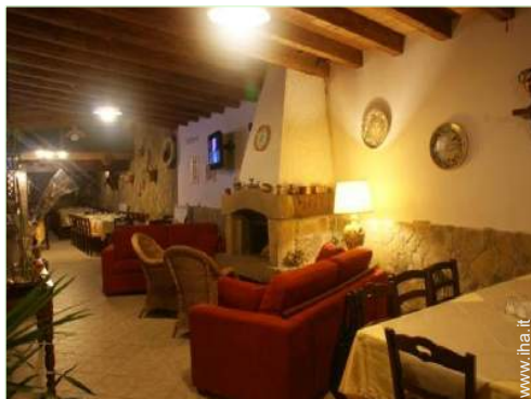
Comfort interno a disposizione degli ospiti