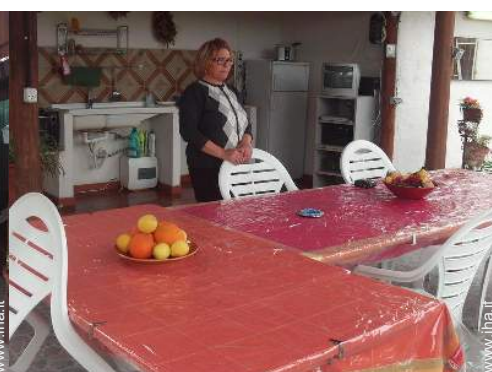
vista dalla veranda