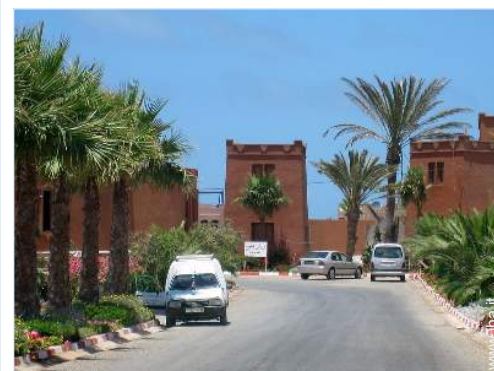
Apprezzamento di terreno