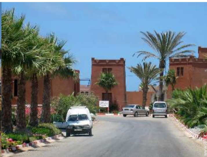
Apprezzamento di terreno