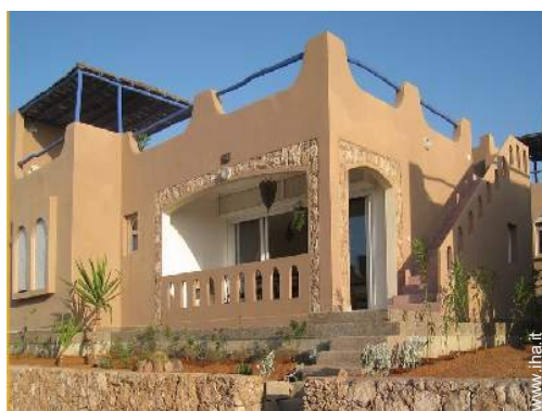
Apezzamento di terreno