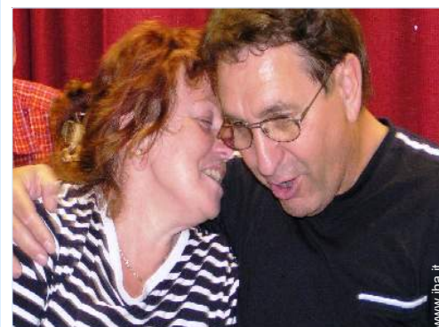
Il vostro ospite