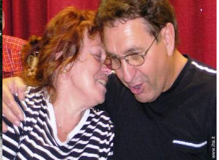
Il vostro ospite