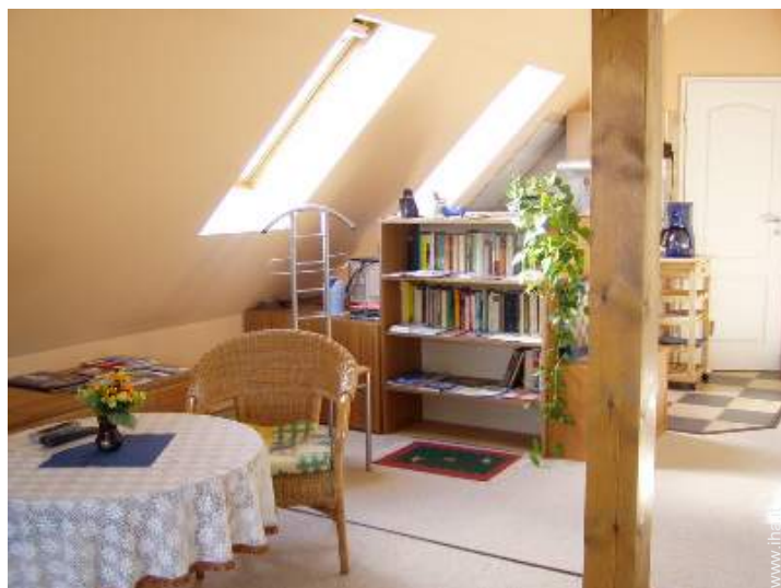
collezione di libri