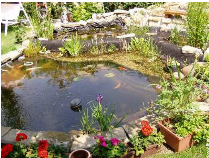
piscina fuori terra