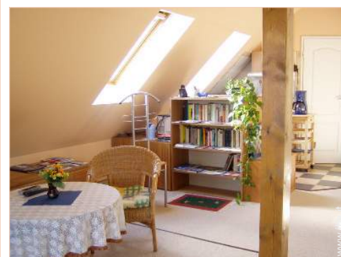
collezione di libri