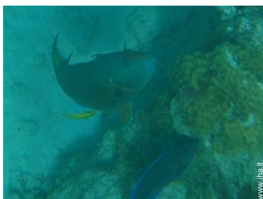
Presenza sul posto