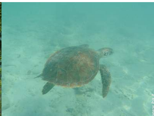
Presenza sul posto