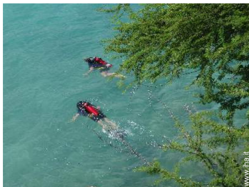
scuola di immersione