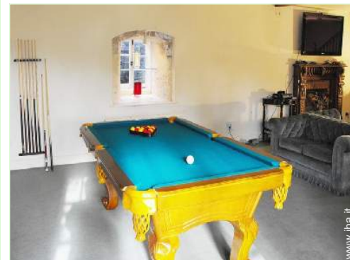
sala dei giochi