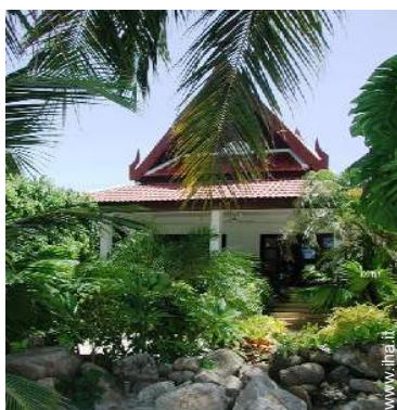
Bungalow di Charme