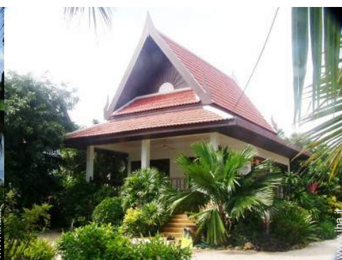
Bungalow di Charme