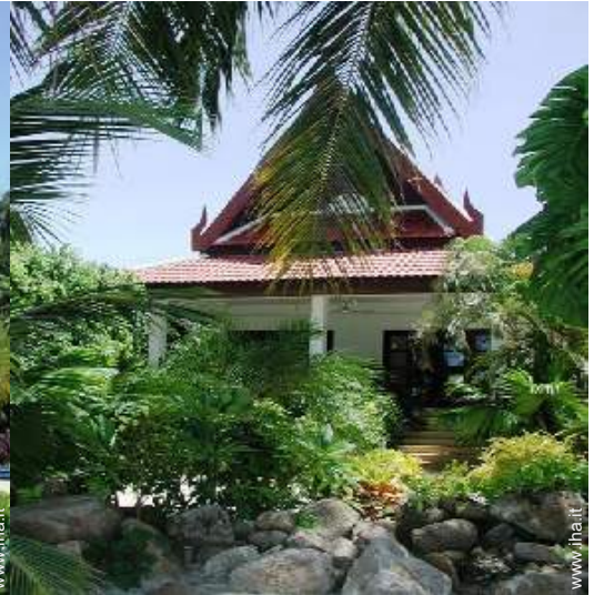
Bungalow di Charme