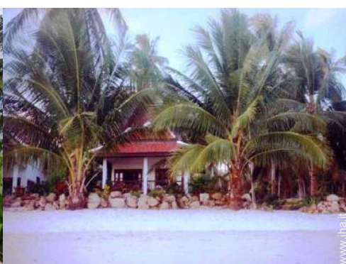
Bungalow di Charme