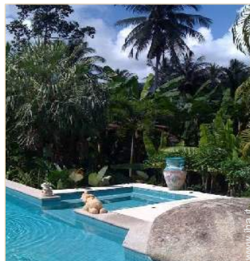
vista sulla foresta