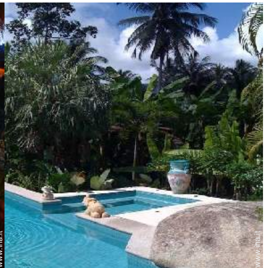
vista sulla foresta