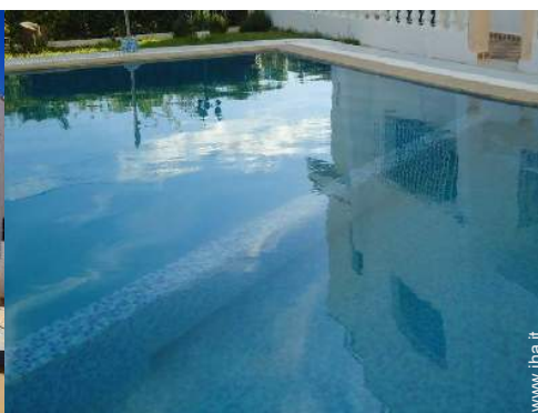
Piscina a sfioro