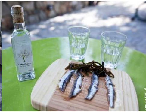
preparazione pasti tipici