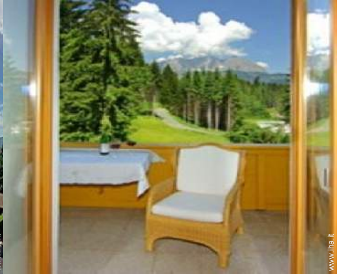
vista dalla loggia