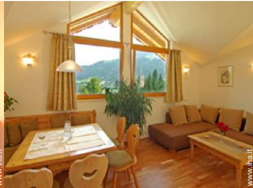
Appartamento di Charme