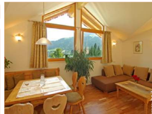
Appartamento di Charme

Barbecue, tavolo da giardino, 10 sedia(e) da giardino, ombrellone, 10 sedia sdraio, altalena, struttura rampicante per bambini, vasca per la sabbia