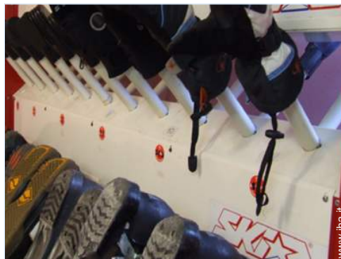
asciuga scarponi da sci

Bambini benvenuti Animali ammessi a condizioni (informarsi presso il proprietario) Presenza sul posto : animali domestici Affitto non fumatori, copertura telefonia mobile Acqua : calda/fredda Tensione elettrica : 220V / 60Hz Alimentazione elettrica : conduttura