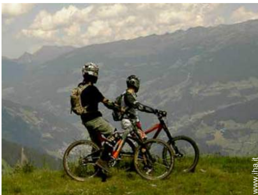
percorso per mountain bike