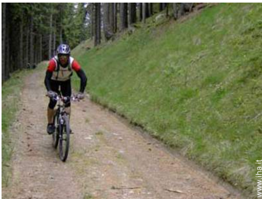
percorso per mountain bike