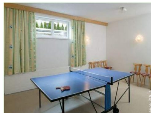
tavolo da ping-pong