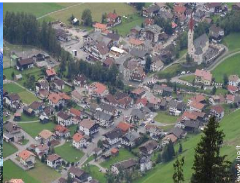
vista sul centro del paese