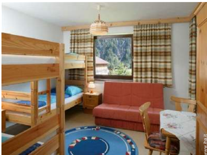
letti a castello