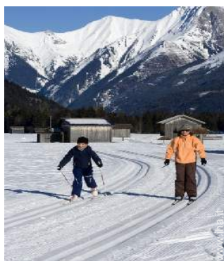
sci di fondo