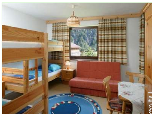
letti a castello