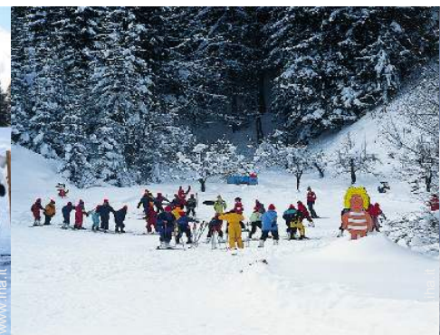
giardino delle nevi per bambini