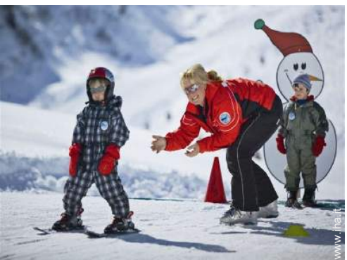
giardino delle nevi per bambini