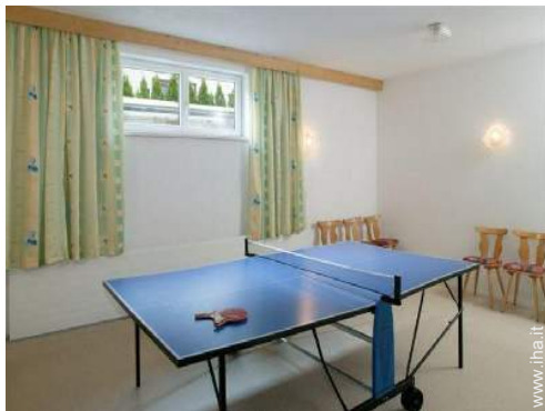
tavolo da ping-pong