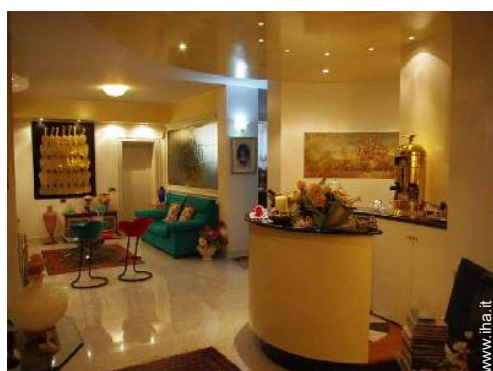
sala di musica