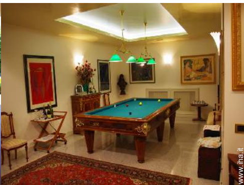
sala dei giochi