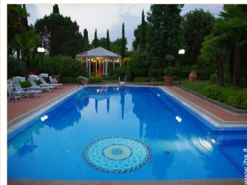
Piscina a sfioro