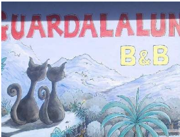
Installazione esterna a disposizione degli ospiti