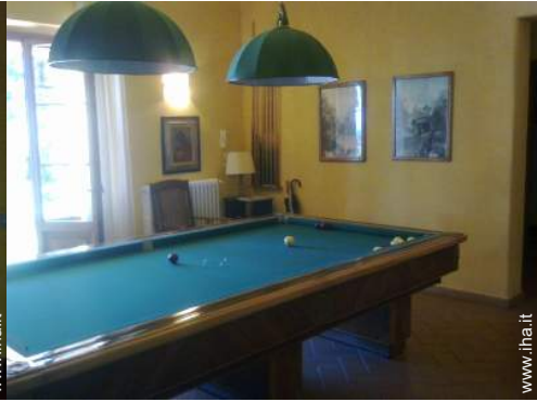
tavolo da biliardo