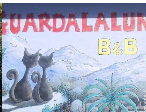
Installazione esterna a disposizione degli ospiti