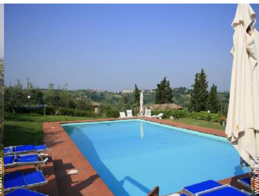
Piscina a sfioro