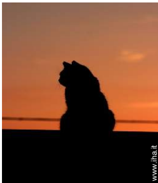
Gli animali domestici