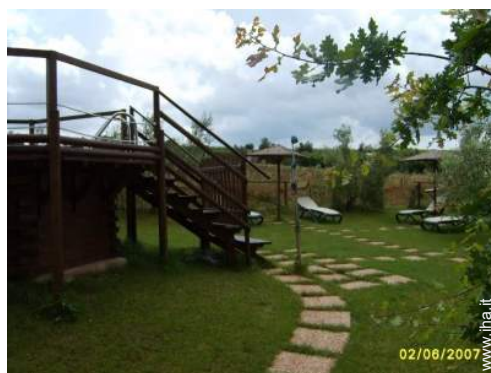
piscina fuori terra