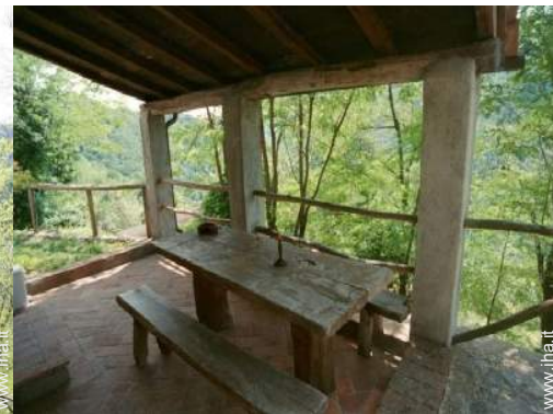
vista dalla loggia