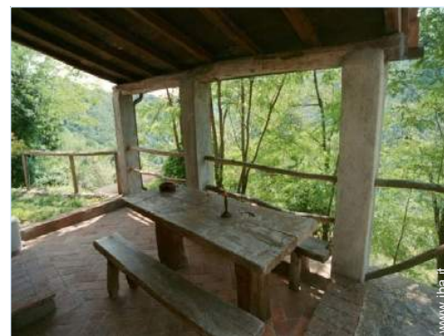
vista dalla loggia