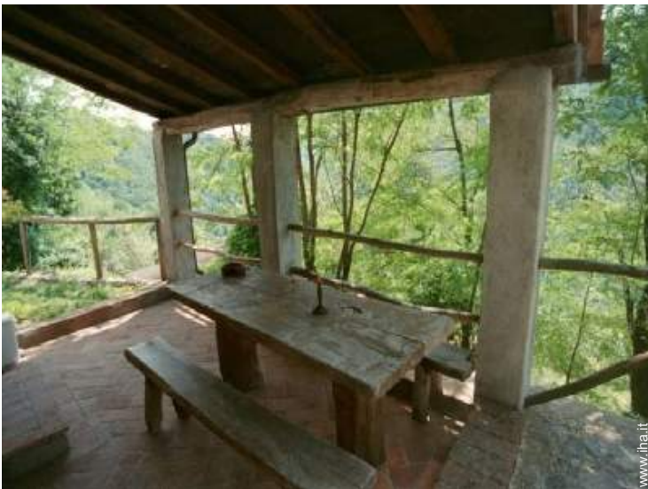
vista dalla loggia