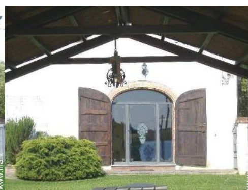
Ambito esterno a disposizione degli ospiti