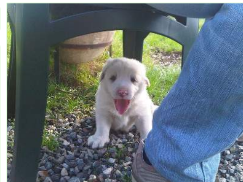
I vostri ospiti

Forno per pizze, barbecue, tavolo da giardino, 20 sedia(e) da giardino, pergolato, ombrellone, 15 sedia sdraio, 4 amaca(che), altalena, doccia esterna