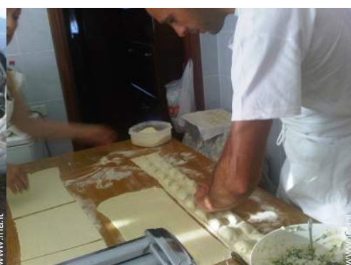
preparazione pasti tipici