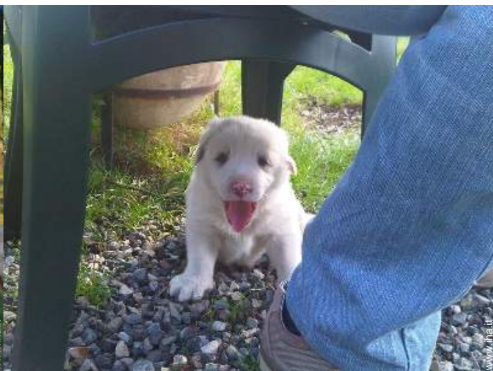
I vostri ospiti