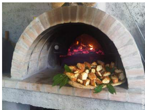
preparazione pasti tipici