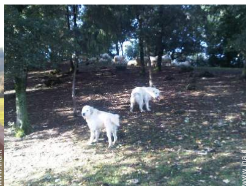
animali da fattoria