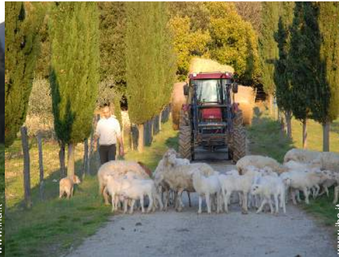
animali da fattoria