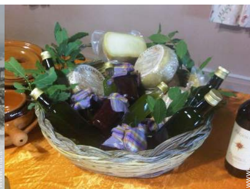
preparazione cesto da pic-nic