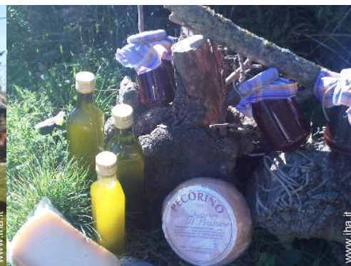
preparazione cesto da pic-nic