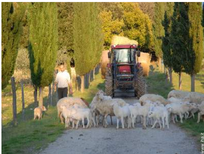
animali da fattoria