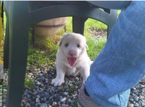
I vostri ospiti