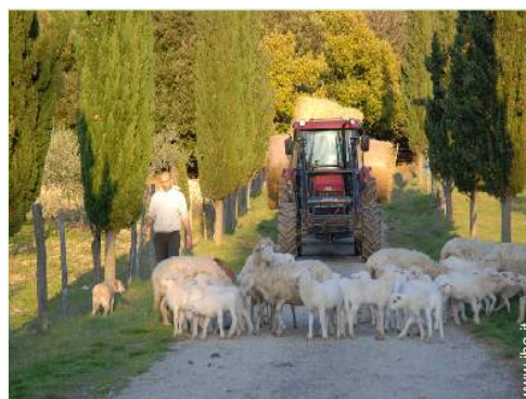
animali da fattoria

Bambini benvenuti Animali ammessi a condizioni (informarsi presso il proprietario) Presenza sul posto : animali domestici, equini, animali da fattoria, animali "selvaggi" Copertura telefonia mobile Acqua : calda/fredda Tensione elettrica : 220-240V / 50Hz Alimentazione elettrica : condotta