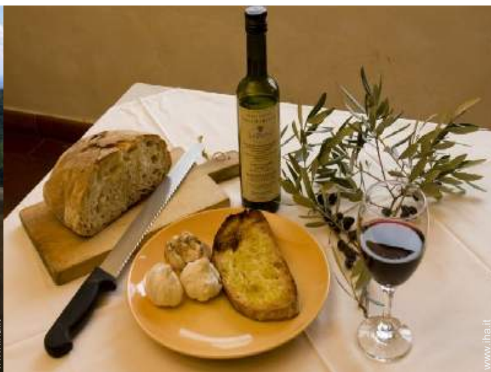
preparazione pasti tipici