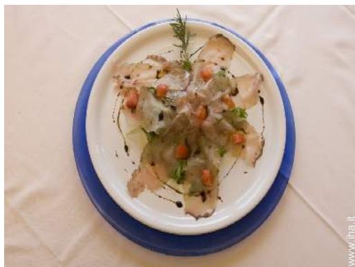
preparazione pasti tipici