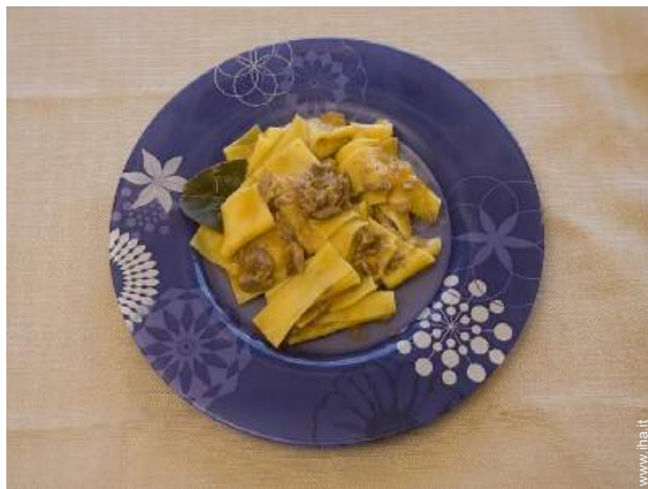
preparazione pasti tipici