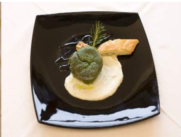
preparazione pasti tipici