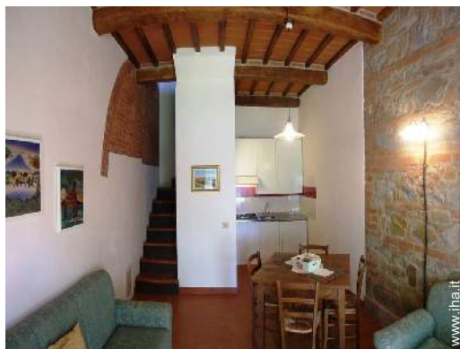
Sistemazione interna a disposizione degli ospiti