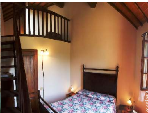
Sistemazione interna a disposizione degli ospiti