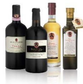
cantina e degustazione di vino