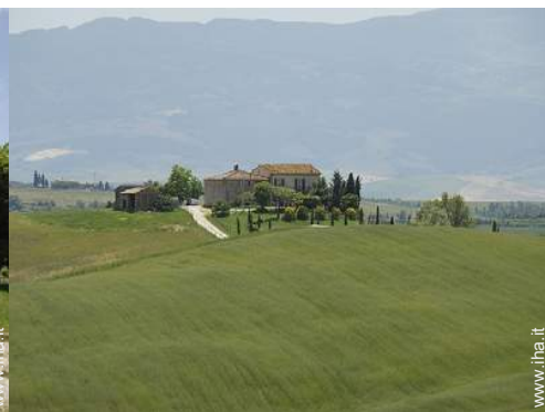
vista sui campi agricoli