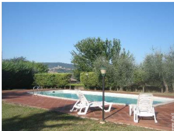
Piscina con acqua di mare