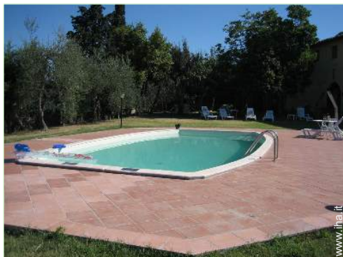
Piscina con acqua di mare