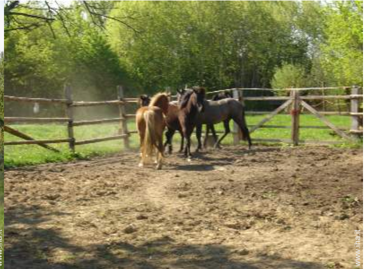
scuola di equitazione