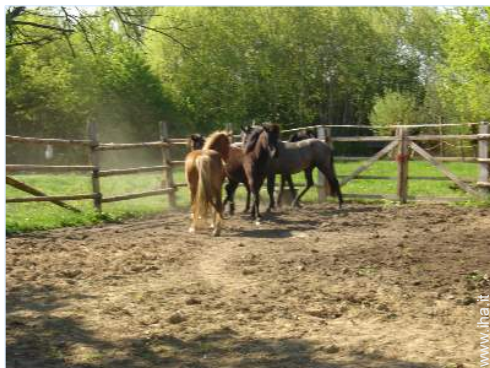
scuola di equitazione