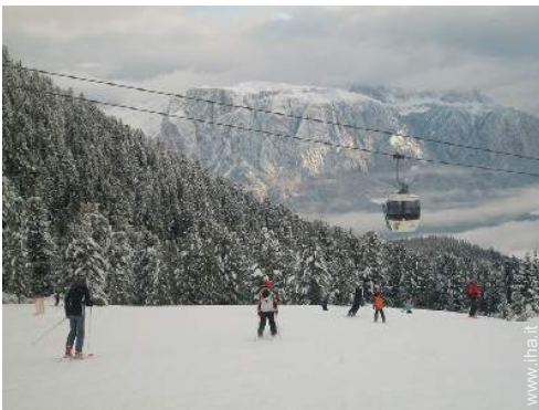
piste di sci