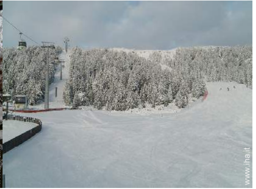
piste di sci