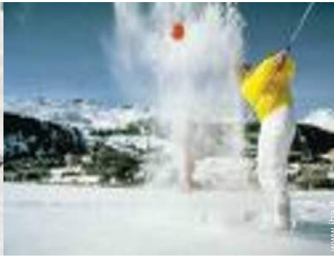
sport invernali nelle vicinanze