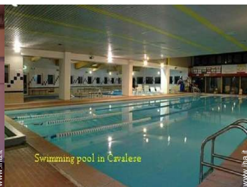
Swimming pool in Cavalese