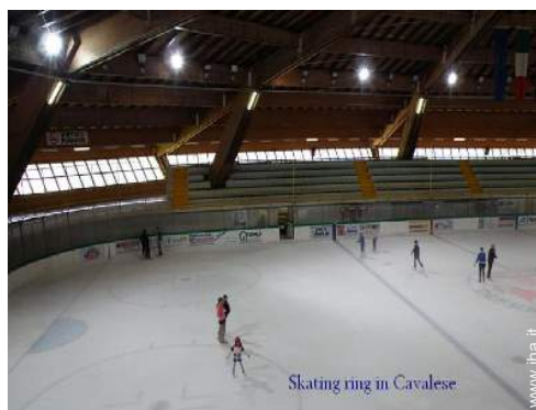
Skating ring in Cavalese