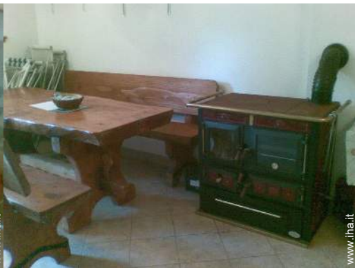
stufa a legna