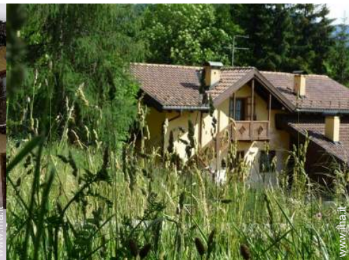
Zona residenziale signorile