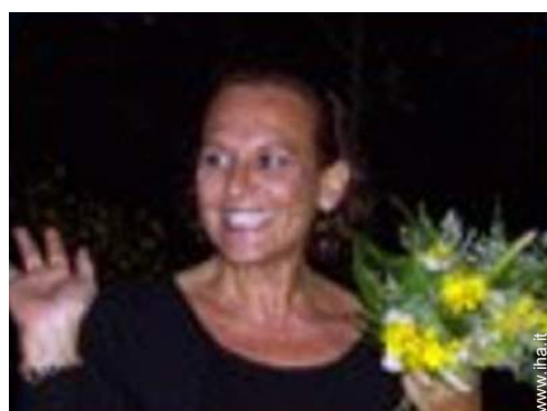
Il vostro ospite