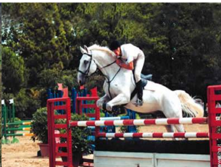
passeggiata a cavallo