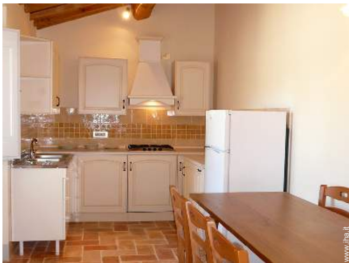
cucina a gas