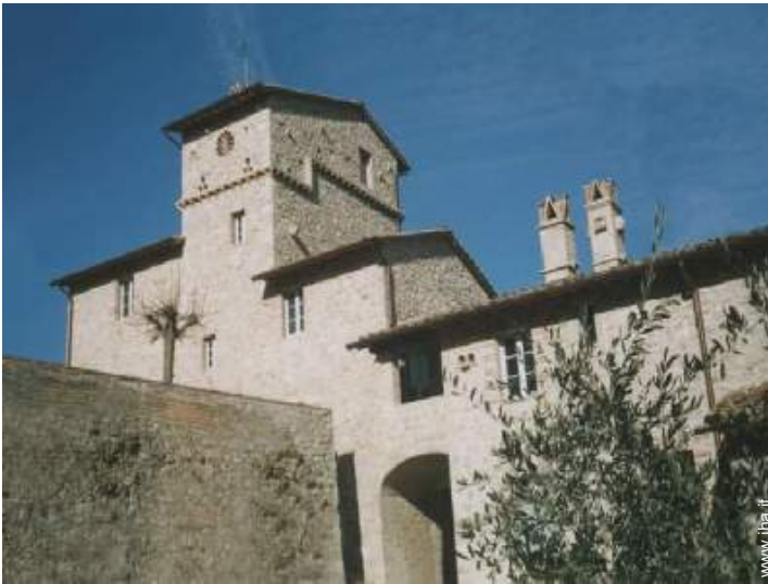
Casolare di Charme