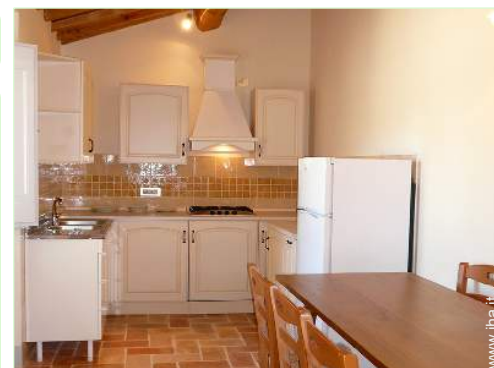
cucina a gas

Barbecue, tavolo da giardino, sedia(e) da giardino, ombrellone, sedia sdraio, dondolo, altalena, doccia esterna, WC esterno