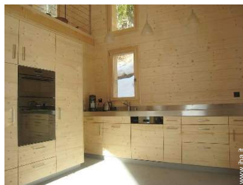
grande cucina in stile americano