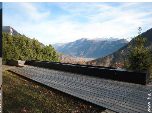
parco e giardino