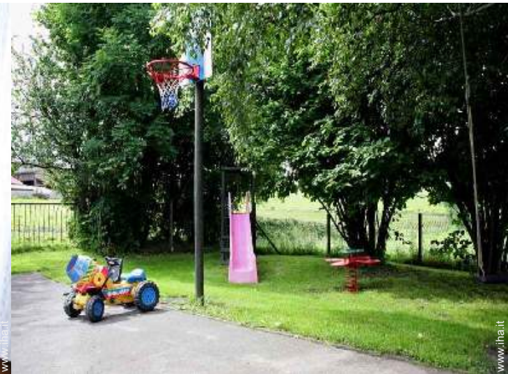
struttura rampicante per bambini