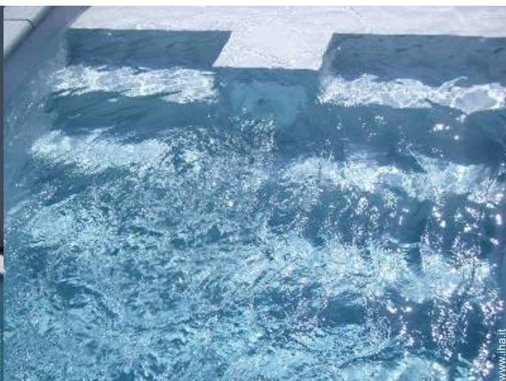
sistema piscina ad onde