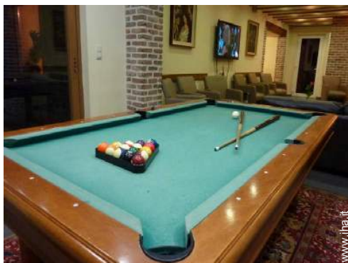
tavolo da biliardo