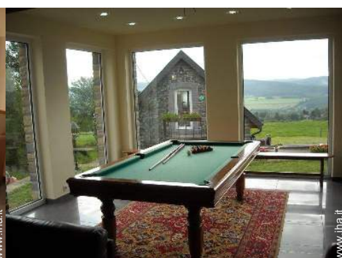
tavolo da biliardo