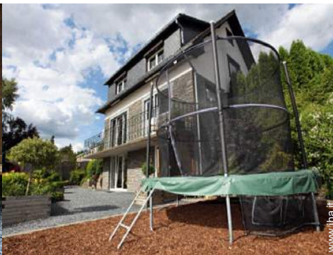
campo di bocce