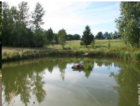
piscina fuori terra