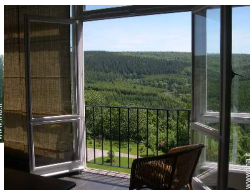
vista sulla foresta