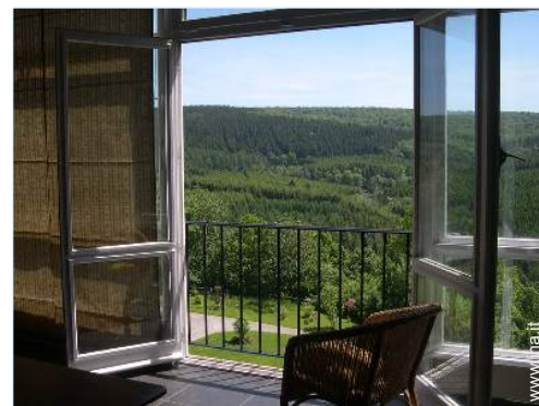
vista sulla foresta