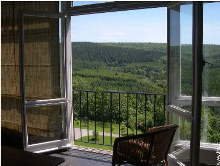
vista sulla foresta