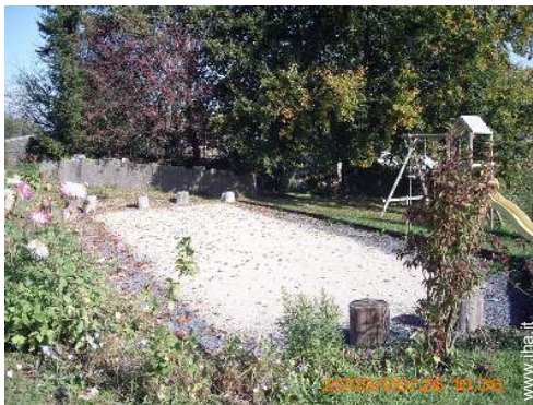
campo di bocce