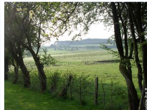
vista sul prato