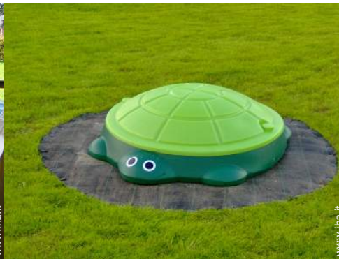
vasca per la sabbia