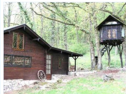
Chalet in Legno

- Villaggio centro 4km - Centro città 5km - Panetteria 3km - Negozi tipici 5km - Supermercato 2km - Ufficio postale 5km - Banca 5km - Distributore automatico di biglietti 2km - Farmacia 5km - Medico 5km - Infermiera 5km - Ospedale 20km