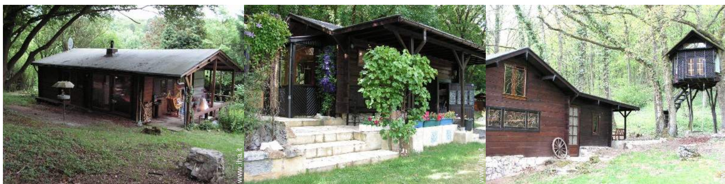
Chalet in Legno