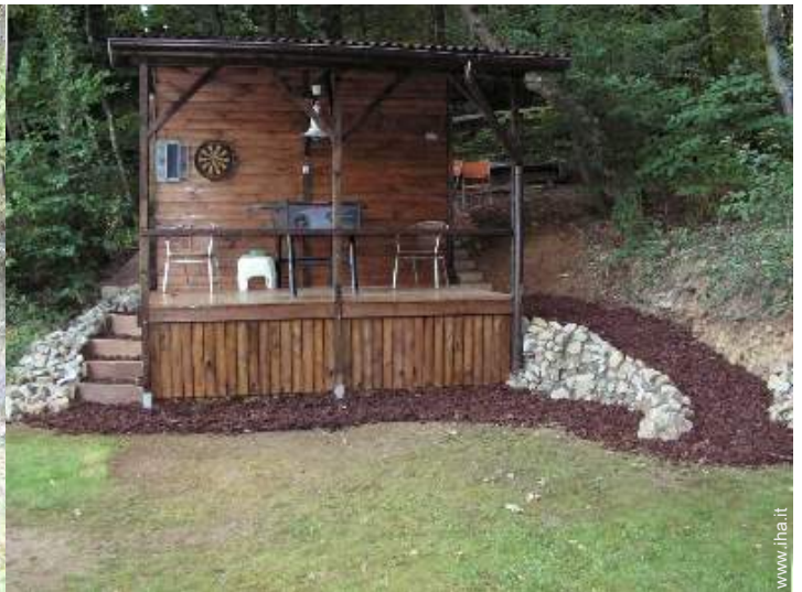
Chalet in Legno