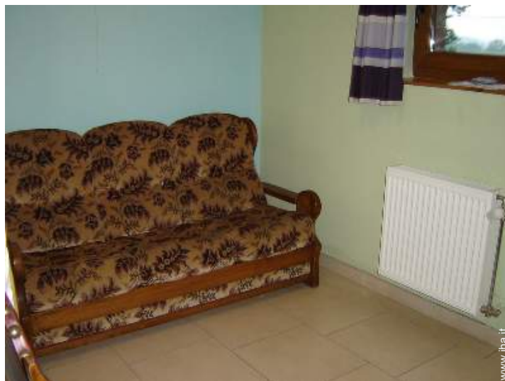
letto(i) a scomparsa 2 pers