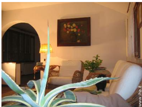
vista dallo studio