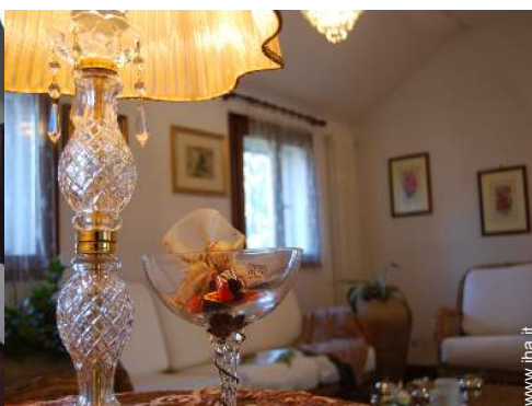
vista dallo studio