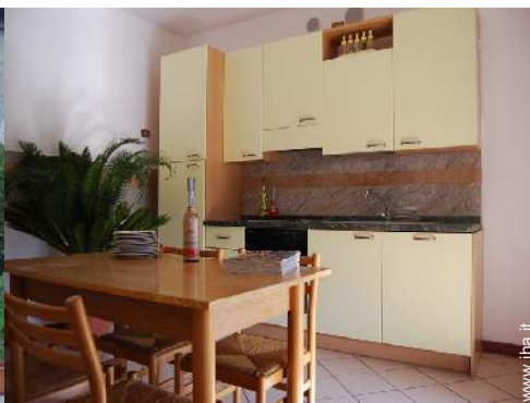
grande cucina indipendente