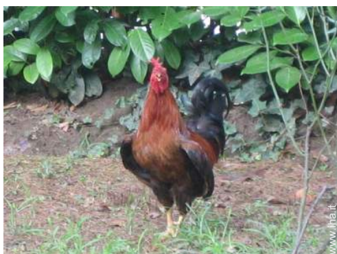
animali da fattoria