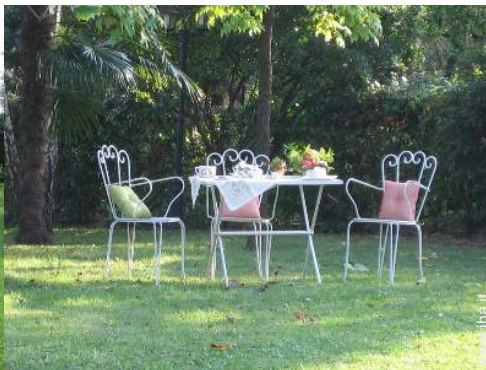
vista sul prato