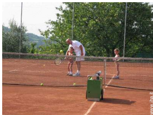
Tennis - terra battuta