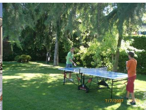
tavolo da ping-pong