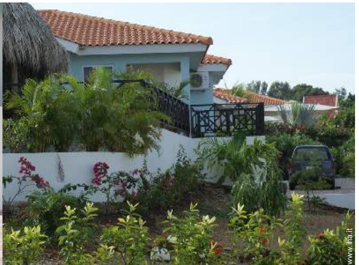
Ambito esterno a disposizione degli ospiti