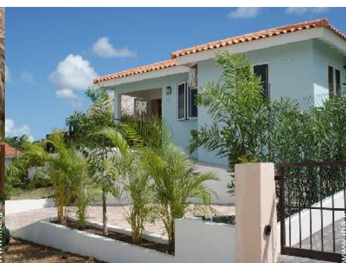
Villa di Charme