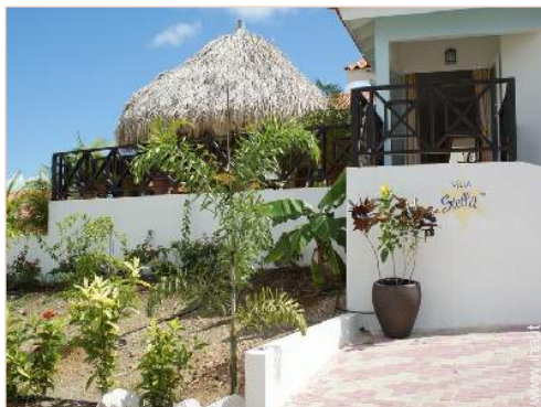
Ambito esterno a disposizione degli ospiti