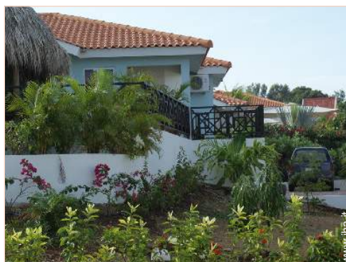
Ambito esterno a disposizione degli ospiti