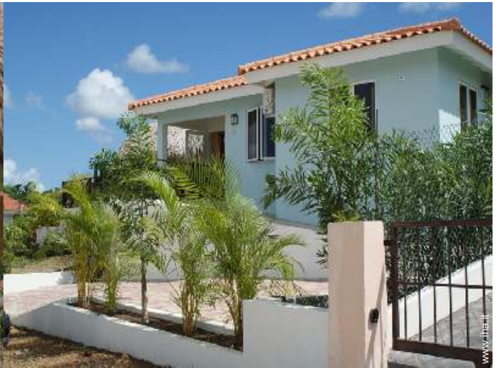
Villa di Charme