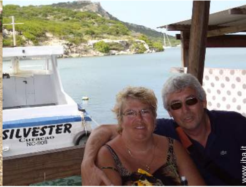
I vostri ospiti