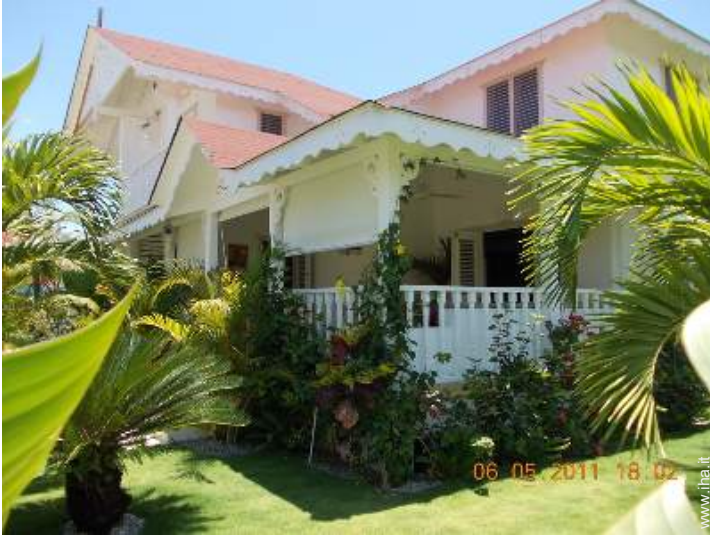
Villa di Charme