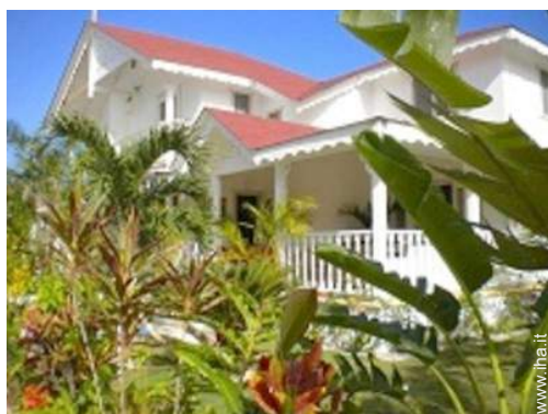
Villa di Charme