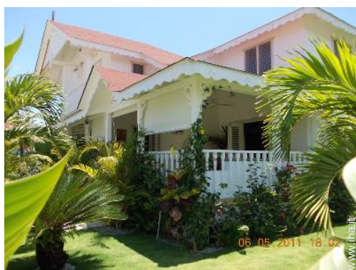
Villa di Charme