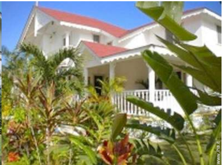
Villa di Charme