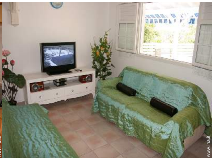
Disposizione interna e confort