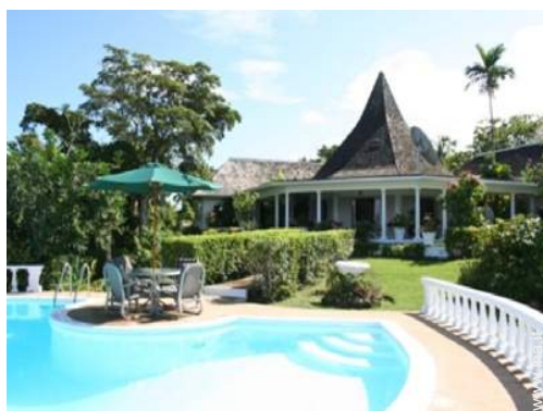
Villa di Charme