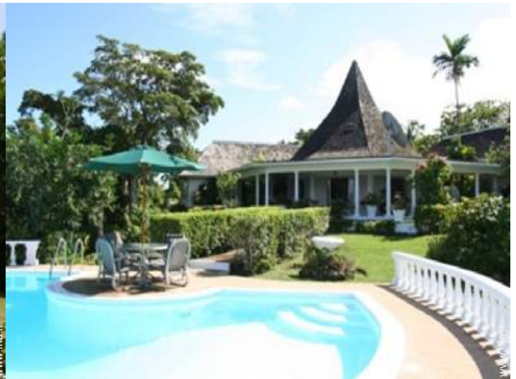
Villa di Charme