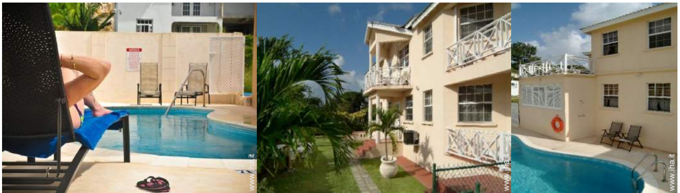
Proprietà di Charme