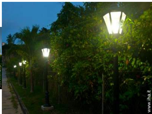
sistema di illuminazione