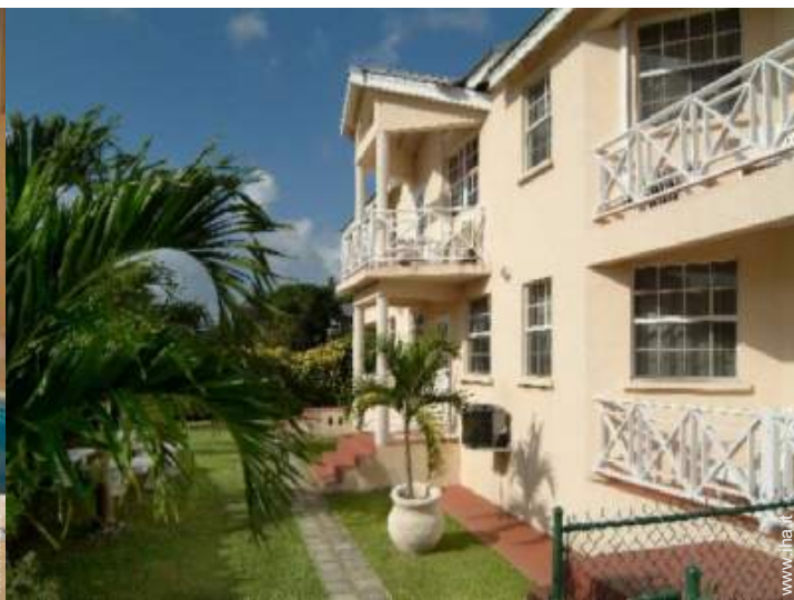
Proprietà di Charme