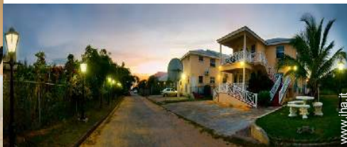
vista sulla strada/viale