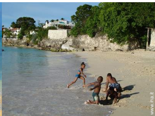
luogo per bagnarsi